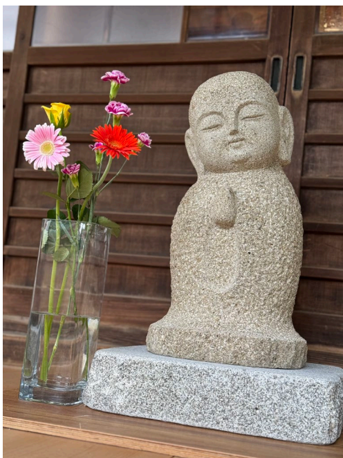
全ての人の安楽を願う和楽地蔵

障がいを持つ方々が当たり前のように自立生活を送れるような社会を目指す活動は、日本でも広く行われています。当事者として、この活動をけん引してきた方の発願により「和楽地蔵」が拙寺に建立されます。誰もが平等に意志と生活を尊重してもらえよう、社会の障がい除かれます事をお願いします。(住)