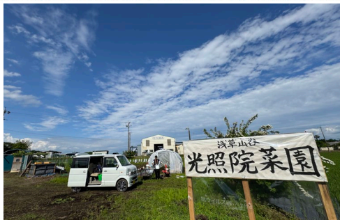
宇都宮市に開園 光照院菜園