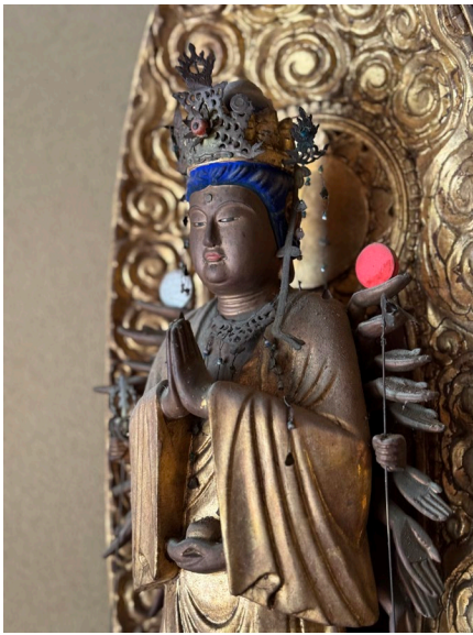
出現十一面千手観音菩薩像 壊滅的な被害を受けた寶幢寺ご本堂の片付けの途中、なんと無傷で出現した十一面千手観音菩薩像。

い想いと行動がなければ願いは叶いません。加えて、思うようにならぬこの世では、「自分だけよければいい！」ではなく、困っている他者へ慈愛を向けることが、共に苦しみを脱していく力となるのだと、この度の視察で被災した輪島の方々に教えられました。私たちの人生もまた、いつ嵐に飲み込まれるかわかりません。阿弥陀様の眼差しのもと、ぜひ自らのために他者にも慈愛を施す幸せを求めてまいりましょう。合掌